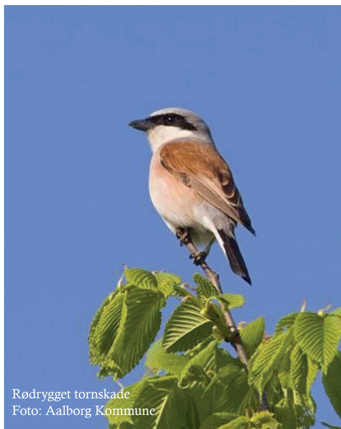
Rødrygget tornskade

Desuden findes store naturværdier i Hammer Bakkers to brunvandede søer; Pebermosen og Brødlands Mose. Områdets sandmarker indgår også som et vigtigt levested for bl.a. flere af de store perlemorsommerfugle. Fuglene rødrygget tornskade og sortspætte yngler i Hammer Bakker.