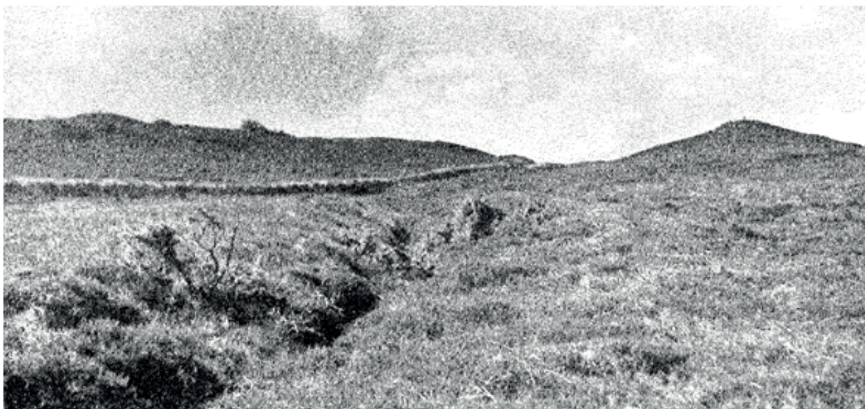
Tvillingehøje set fra Gamle Sæbyvej inden tilplantning. 1929-1931

Langs vejen findes mange gravhøje, nogle med markant beliggenhed og vid udsigt. Inden tilplantningen for 100 år siden var det muligt at se både Limfjorden og Kattegat fra gravhøje i bakkerne. Områdets mange tilgroede fortidsminder og øvrige kulturspor rummer store potentialer i forhold til sikring og formidling, som forventes håndteret i projektet.